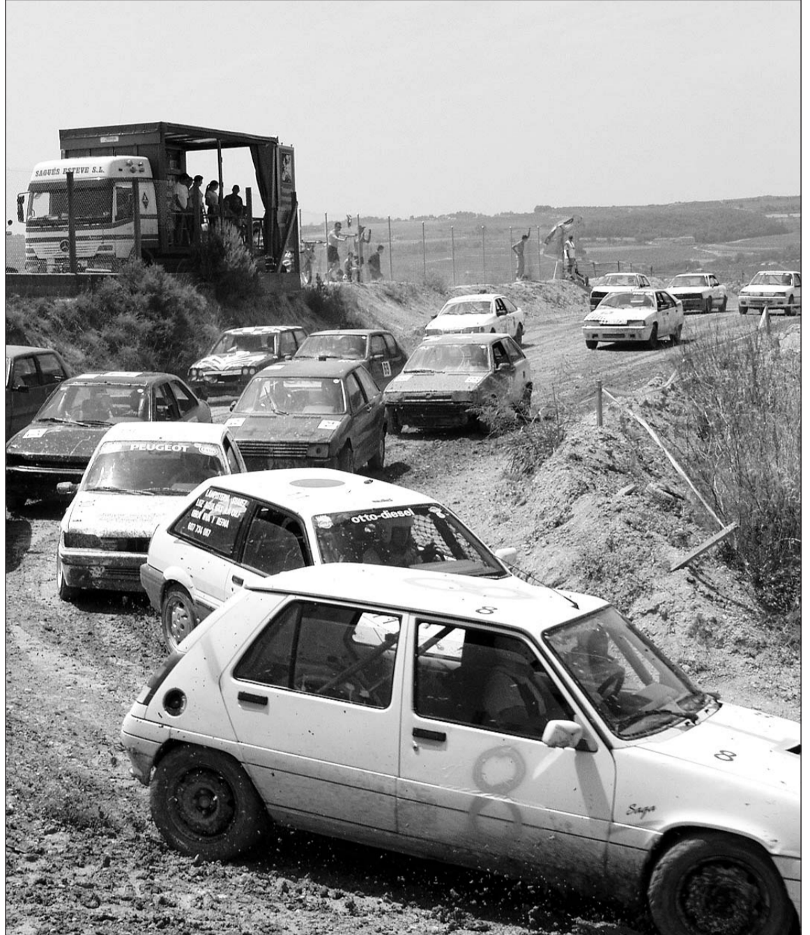
Un moment de la sortida de la cursa final. Molts dels cotxes participants van patir la duresa del circuit