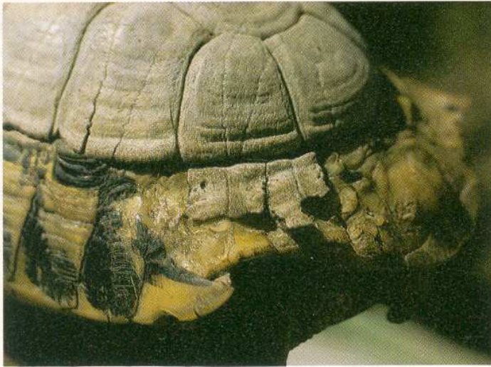
Figura 2. Imagen del caparazón de la hembra de Testudo hermanni hermanni 5 años después de haber sido afectada por el fuego. A la izquierda de la imagen se observan placas córneas marginales normales (no afectadas por las quemaduras). Arriba de la imagen se ve el caparazón óseo que ha permitido la regeneración. A la derecha de la imagen se observa el caparazón cicatricial y en el centro pueden apreciarse dos piezas óseas casi desprendidas debido a que, bajo ellas, la regeneración se ha completado.

puntuales del mismo (GARNER et al. , 1997).