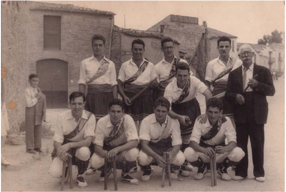
La Beguda Alta, 1952.

En Tonet amb els Bastoners de La Beguda.