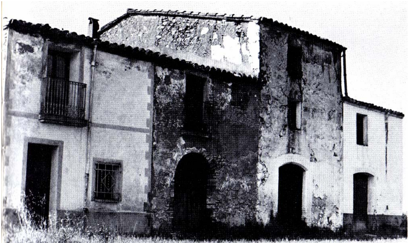
Barriada de Cal Sant Isidre, a Subirats.