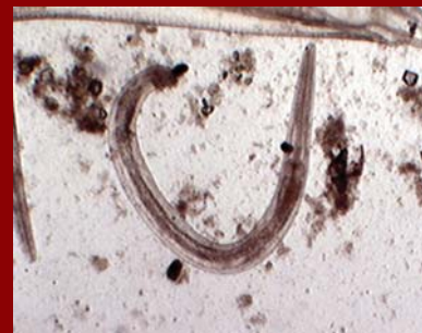
Oxiuros de Tortuga Carbonaria.