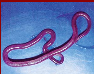
Adulto de nematodo Agusticaecum en una Tortuga Mora.

• Histología: raras veces es diagnóstico in vivo del animal. Sólo mediante biop-