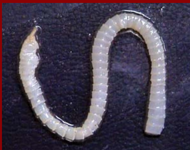
Cestodo de un varano.